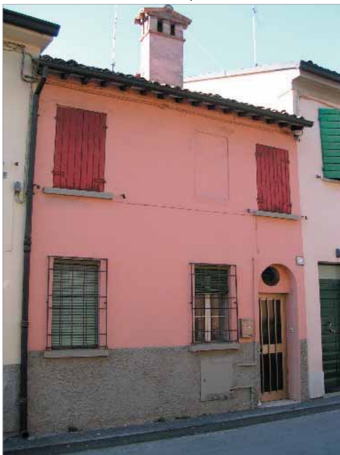
Via Berti 25 Fronte Principale